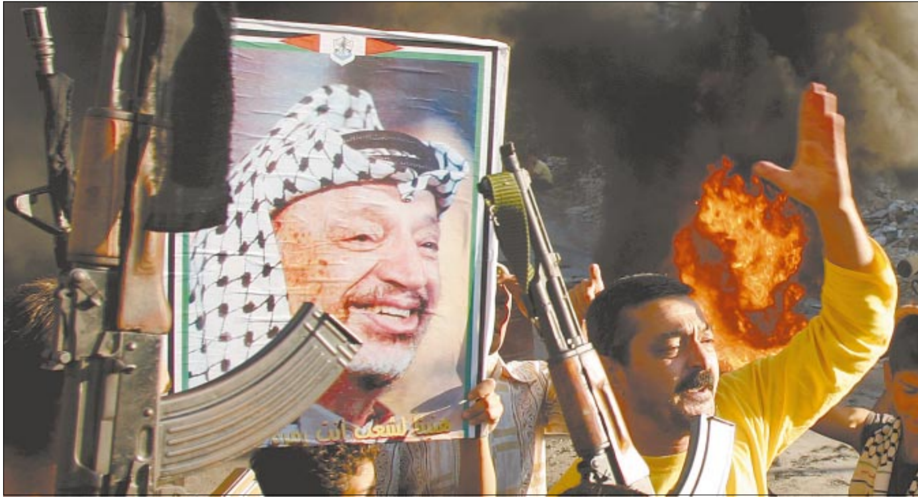
Ain al-Hilweh, Líbano

Desaparecimento do líder palestino abre intrincado jogo diplomático da sucessão e da paz na região