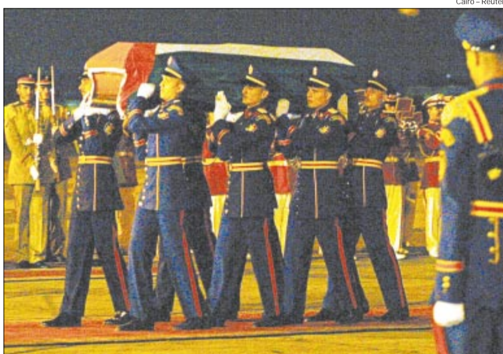
Cairo - Reuters